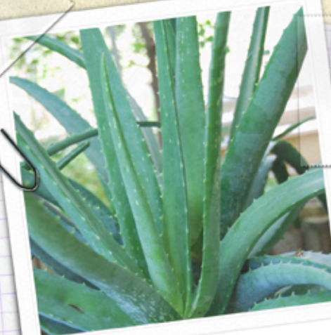
aloès Aloe vera

Hydratante et cicatrisante , elle permet de soigner les brûlures. On la trouve dans de nombreux produits cosmétiques pour la peau. Riches en minéraux , acides aminés, oligo-éléments, elle est aussi réputée pour ses propriétés digestives .