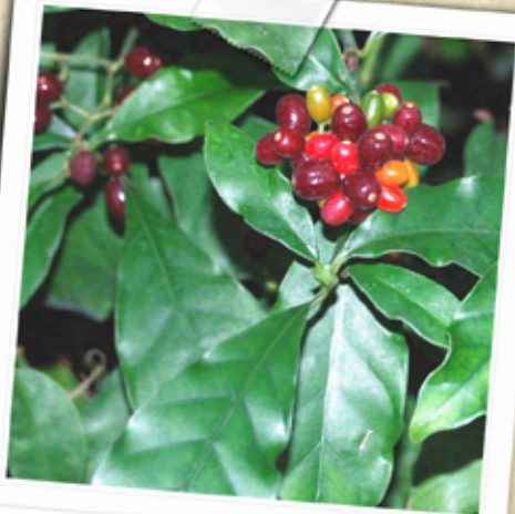
ipeca Psychotria ipecacuanha

C'est grâce à Marco Polo et son voyage en Chine que l'on connaît les qualités de l' Aloe vera . Il est recommandé contre de nombreux troubles gastro-intestinaux.