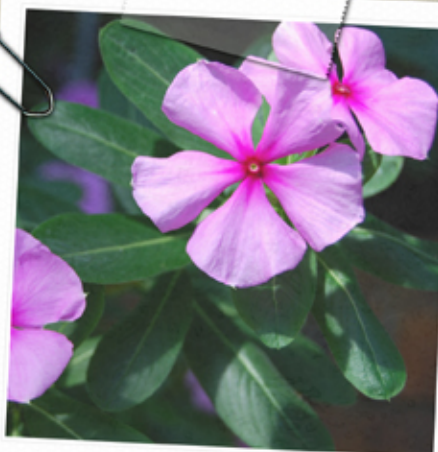
pervenche de Madagascar Catharanthus roseus

Les malgaches utilisent la pervenche pour ses propriétés "coupe faim". C'est en 1957 que Noble (Canada) et Svoboda (Etats-Unis) ont mis en évidence l'effet anti-leucémique.